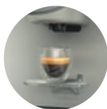
Nastaviteľný stojan na pohár