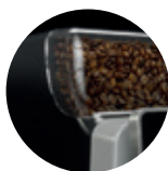
Viditeľný zásobník na kávové zrná