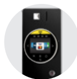
*Platobné systémy (mincovník, bezkontaktná platba)

*Dostupný vo viacerých variantách, aby vyhovoval rôznym potrebám každej firmy. Ponúkame riešenie aj v rámci platobného systému. Ponuka kávovaru sa môže líšiť od aktuálnych skladových zásob.